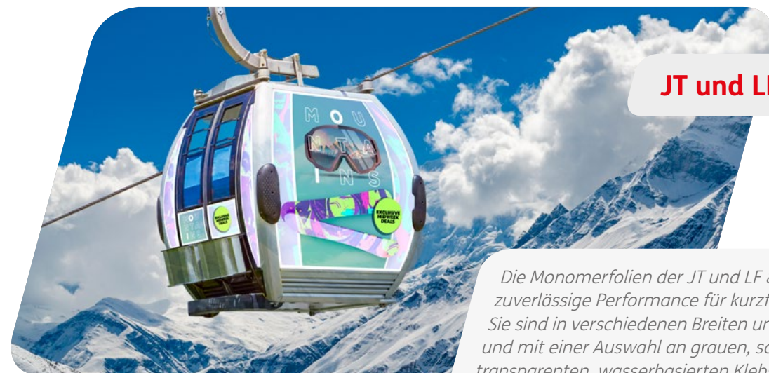
JT und LF 8500 Serien

Die Monomerfolien der JT und LF 8500 Serie bieten eine zuverlässige Performance für kurzfristige Anwendungen. Sie sind in verschiedenen Breiten und Oberflächen und mit einer Auswahl an grauen, schwarzen und transparenten, wasserbasierten Klebstoffen verfügbar.